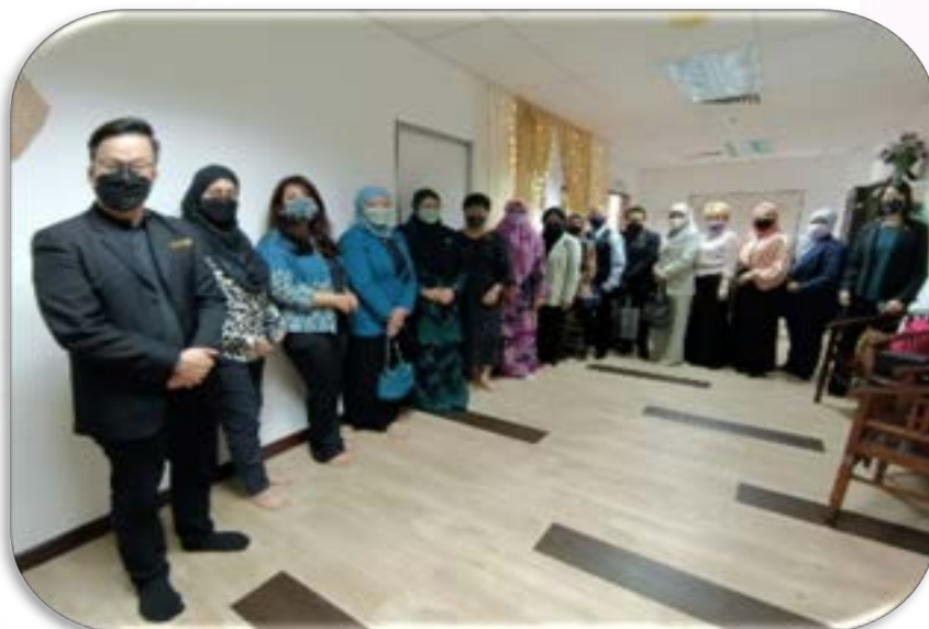
Focus Group Discussion Industri Spa Dan Terapi Kecantikan

31 Mac 2022 – Bahagian Kolaborasi Industri & Komuniti (BKIK) telah mengadakan Mesyuarat Kolaborasi di antara Jabatan Pendidikan Politeknik dan Kolej komuniti (JPPKK) bersama Industri Spa dan Terapi Kecantikan yang bernama Focus Group Discussion Industri Spa Dan Terapi Kecantikan bertempat di Kolej Komuniti Bayan Baru (KKBU).